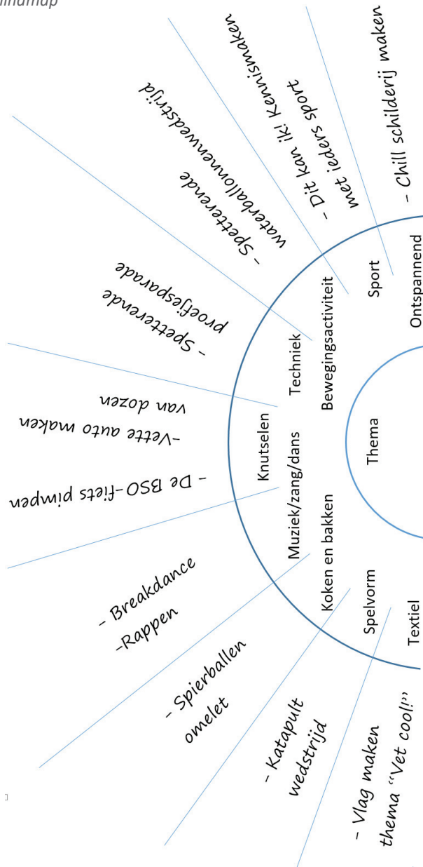
Figuur 1: Mindmap